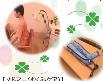
【ドマー(むくみケア)】