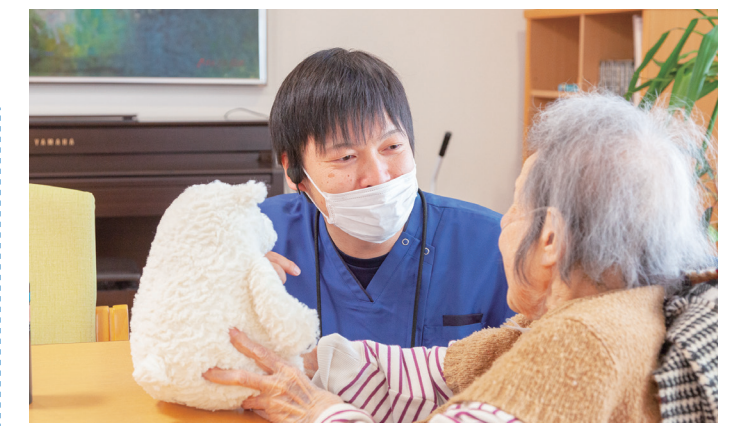
アットホームな雰囲気にご入居者もリラックス。家族的でありながら尊敬を持って接するよう心がけています。