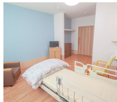
淡いブルーの壁がアクセントになった心落ち着く空間。エアコン、洗面台、トイレ、収納、ナースコールを完備。

ゆったりとしたプライベート空間で過ごしてもらいたいと、全室、国の基準より広めの設計になっています。3人掛けのソファや使い慣れた家具の持ち込みも可能。ご家族が面会の際もゆっくり過ごすことができます。簡易ベッドを置くスペースもあり、宿泊も可能。お看取りの際も最期までご家族が寄り添えるよう想いを込めた広さです。