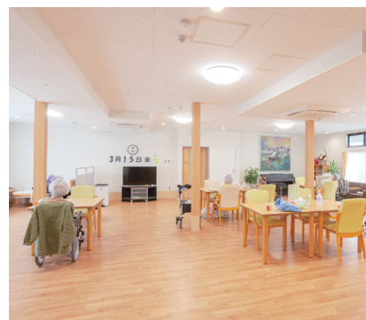
デイサービスがない時も、できるだけリビングに集まって、体操や手芸、読書など和やかに過ごしています。

小規模ならではのアットホームな雰囲気が魅力のホーム。日々の暮らしの中でも、「思い出の神社に行きたい」「レストランで食事がしたい」など、個人のご要望にお応えして、外出レクの企画、夏祭りや餅つきなどの地域行事にも積極的に参加する機会をつくり、社会とのつながりをたいせつにしています。