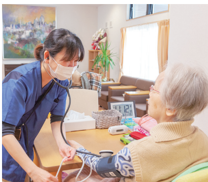
朝のバイタルチェック。何気ない会話を通して小さな変化に気づけるのも、毎日接しているスタッフだからこそ。

看多機は、1つの手続きで、訪問看護・訪問介護・デイサービス・宿泊の4つのサービスをまとめて受けられることが最大のメリット。胃ろうや喀痰吸引、褥瘡でこまめな体位交換が必要な方など、医療・介護ニーズの高い方にとって、いつでも、何度でも、同じスタッフからサービスを受けられることは何よりの安心です。